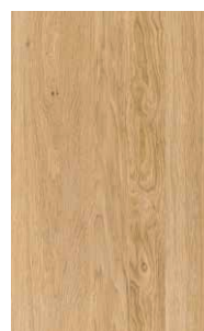
eikenhout witte olie