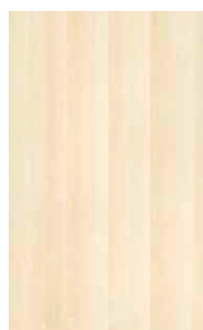
esdoornhout witte olie