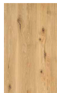
wild eikenhout witte olie*