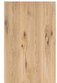
Eiche Wild Weißöl*