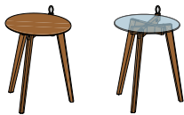
BT HI H5