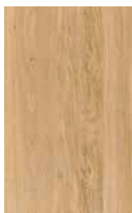
rovere olio bianco