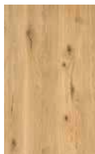
rovere selvatico olio bianco*