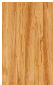
cœur de hêtre