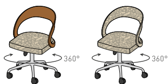
GFK PH R