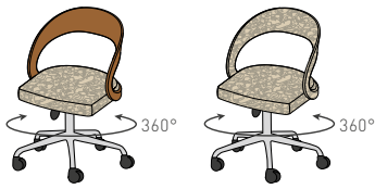
GFK PH R