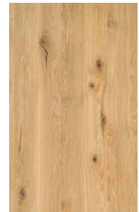
Eiche Wild Weißöl*